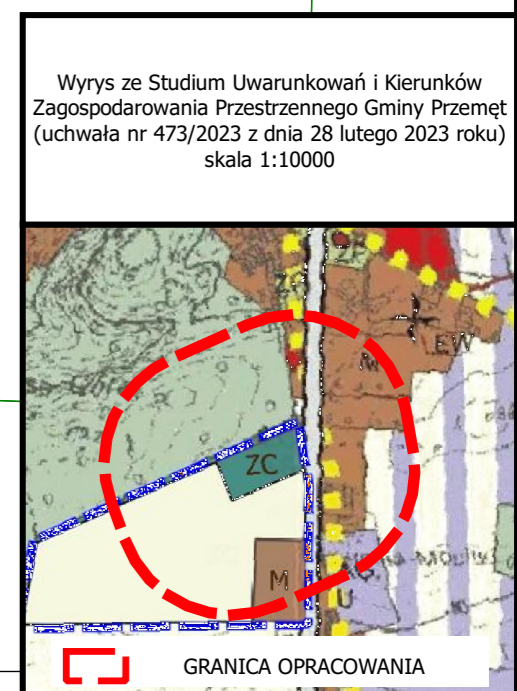
Wyrys ze Studium Uwarunkowań i Kierunków Zagospodarowania Przestrzennego Gminy Przemęt (uchwała nr 473/2023 z dnia 28 lutego 2023 roku) skala 1:10000